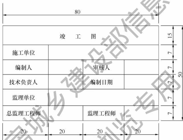
图 4.2.8 竣工图章示例

1 竣工图章的基本内容应包括：“竣工图”字样、施工单位、编制人、审核人、技术负责人、编制日期、监理单位、现场监理、总监。